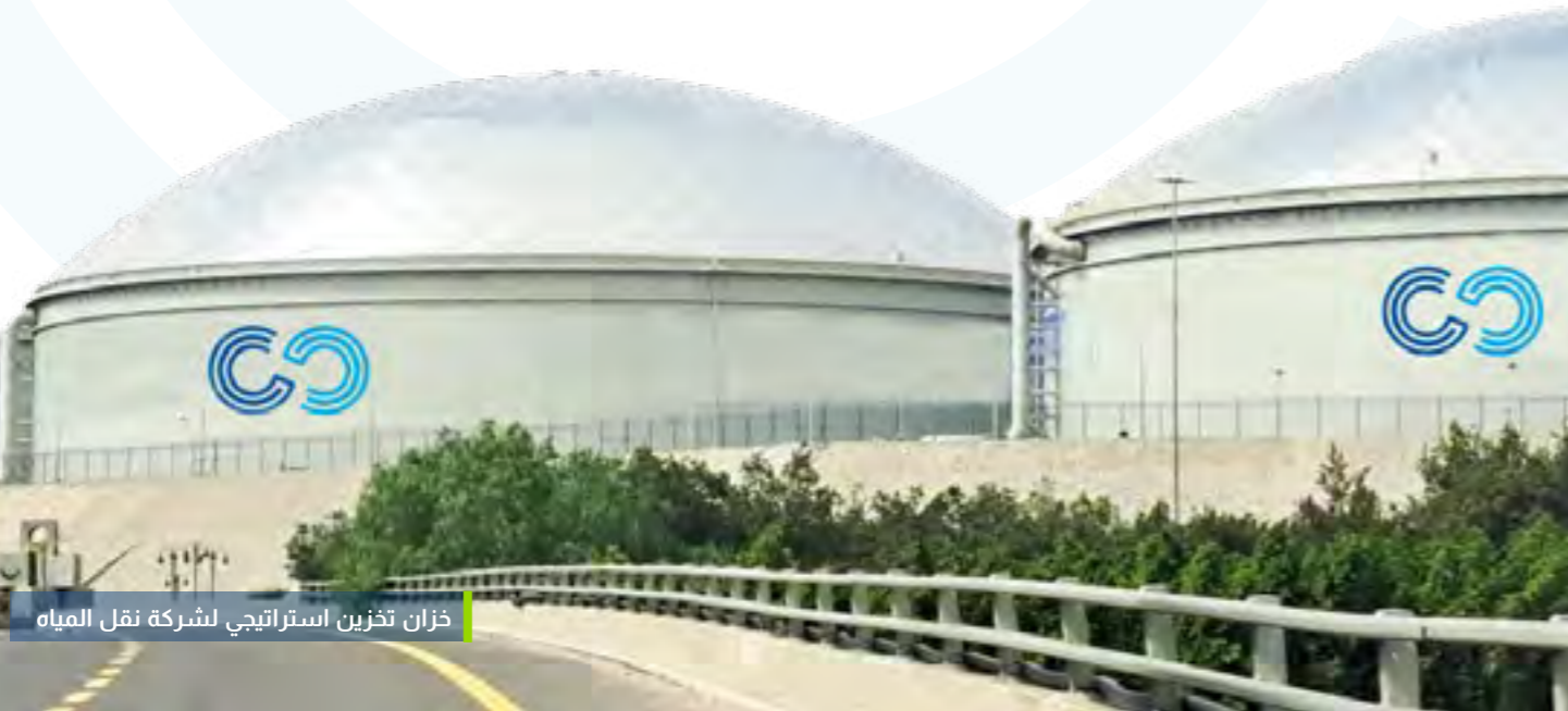
خزان تخزين استراتيجي لشركة نقل المياه

كرسنا جهودنا لتصميم وتحسين أنظمة نقل المياه والخزن الاستراتيجي بهدف المساهمة الفعالة في تعزيز قطاع المياه، وتحقيق الاستدامة المالية من خلال إيجاد حلول تمويلية تجارية لتطوير المشاريع.