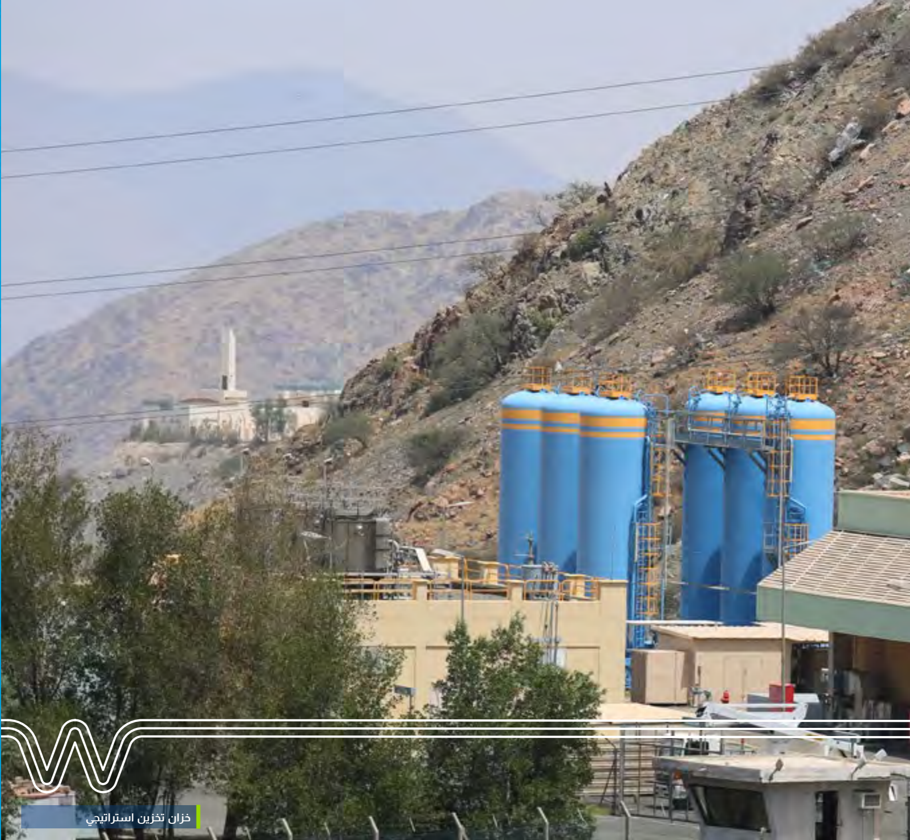
خزان تخزين استراتيجي