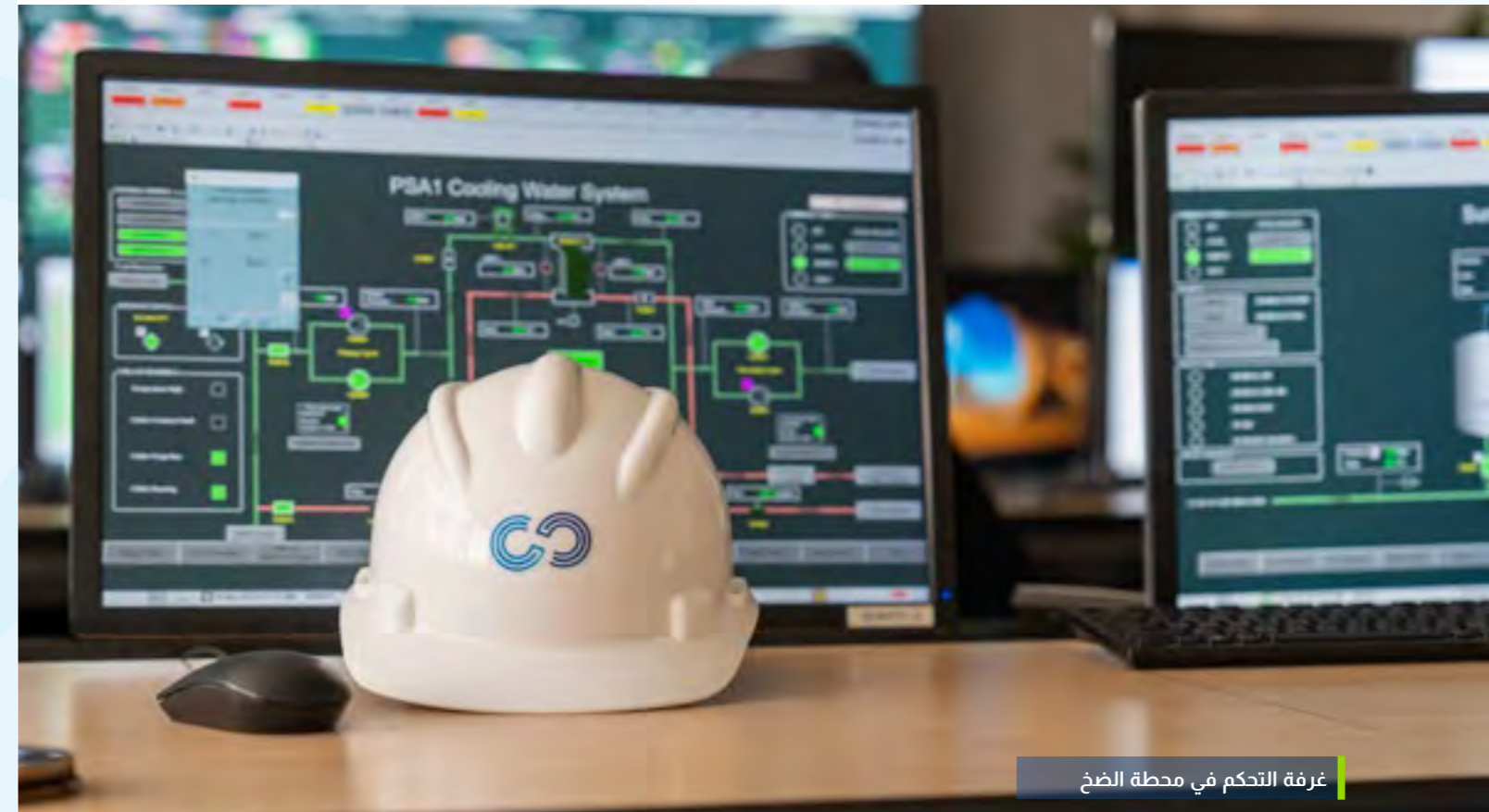
غرفة التحكم في محطة الضخ

صُمم هذا التقييم على أساس منهجي قائم على الأدلة، يدمج ما بين التحليلات الداخلية ووجهات النظر الخارجية من الأطراف المعنية، لتحديد القضايا المتعلقة بالممارسات البيئية والاجتماعية والحكومة وإيلاء الأولوية للأكثر تأثيرًا على نجاحنا وخدمة أصحاب المصلحة لدينا.