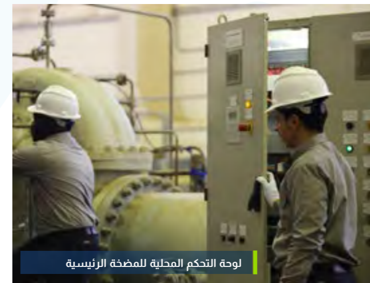
لوحة التحكم المحلية للمضخة الرئيسية