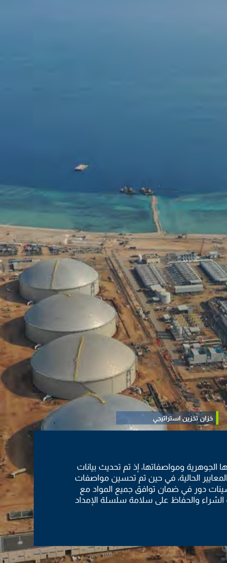
خزان تخزين استراتيجي