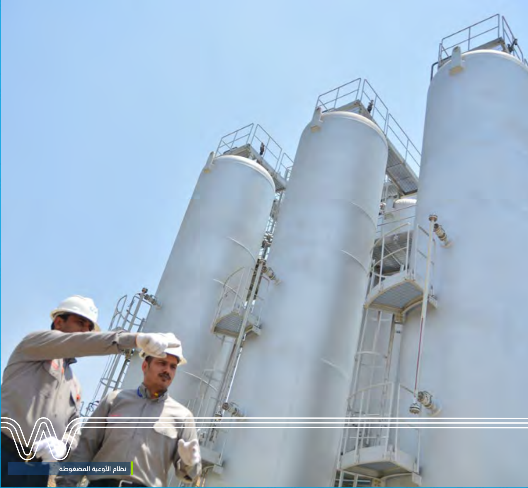
نظام الأوعية المضغوطة