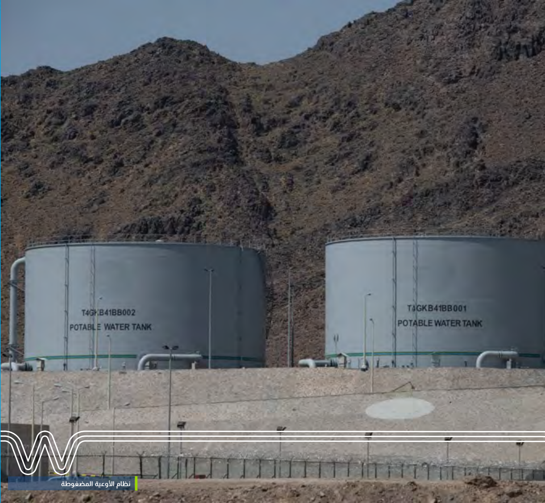
نظام الأوعية المضغوطة