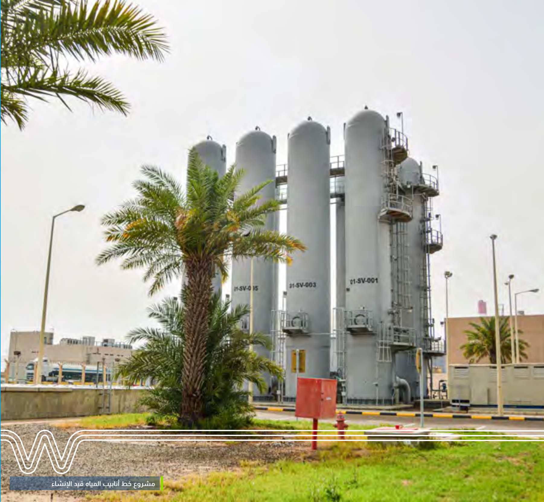
مشروع خط أنابيب المياه قيد الإنشاء